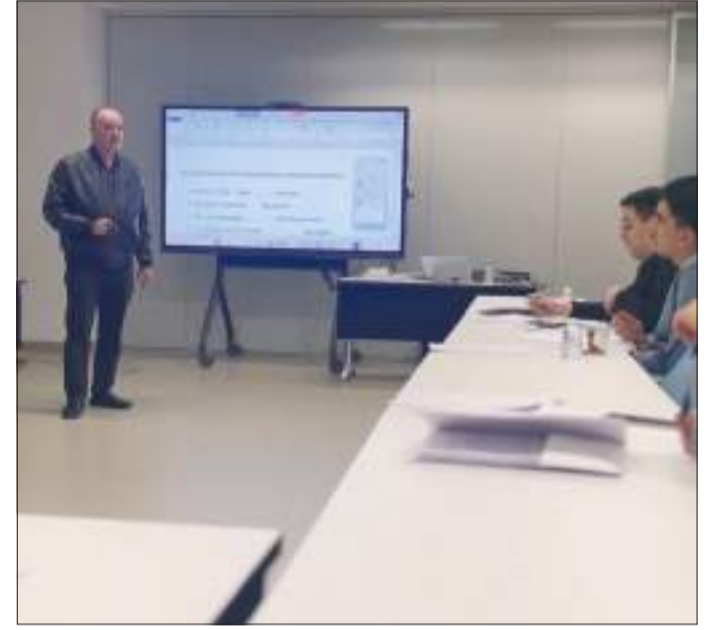
جانب من الدورة