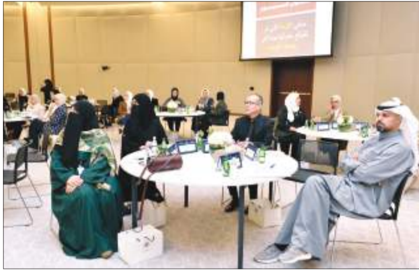
جانب من الملتقى