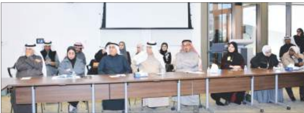
جانبا من الحضور

نقاشية، تخلل اليوم الأول منها جلستان تناولت واقع الأمن الاجتماعي بدولة الكويت.