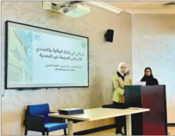
جانب من الاختبارات