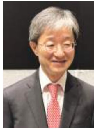
السفير الياباني موكاي كينيتشيرو