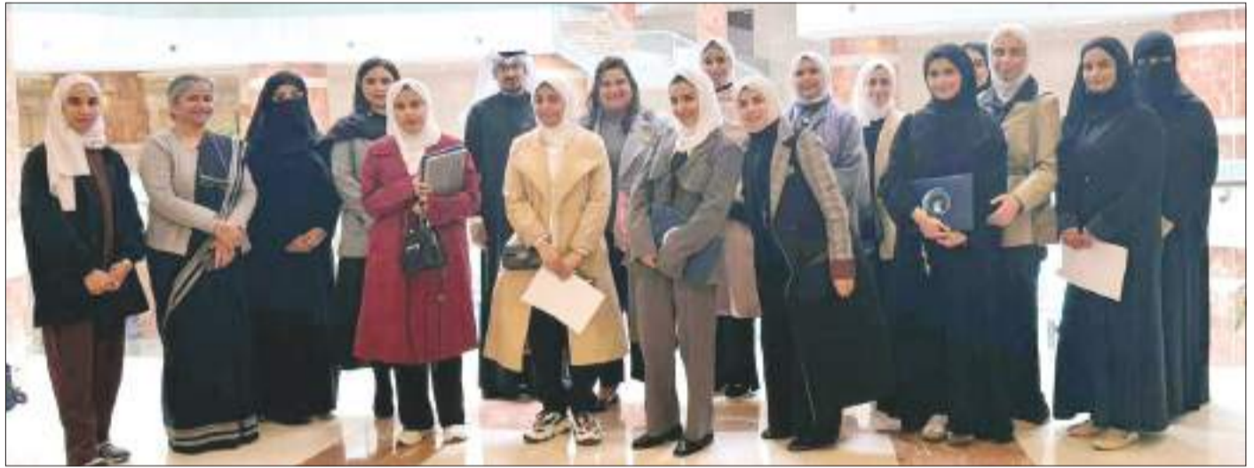
لقطة جماعية لممثلي وزارة الصحة والجامعة