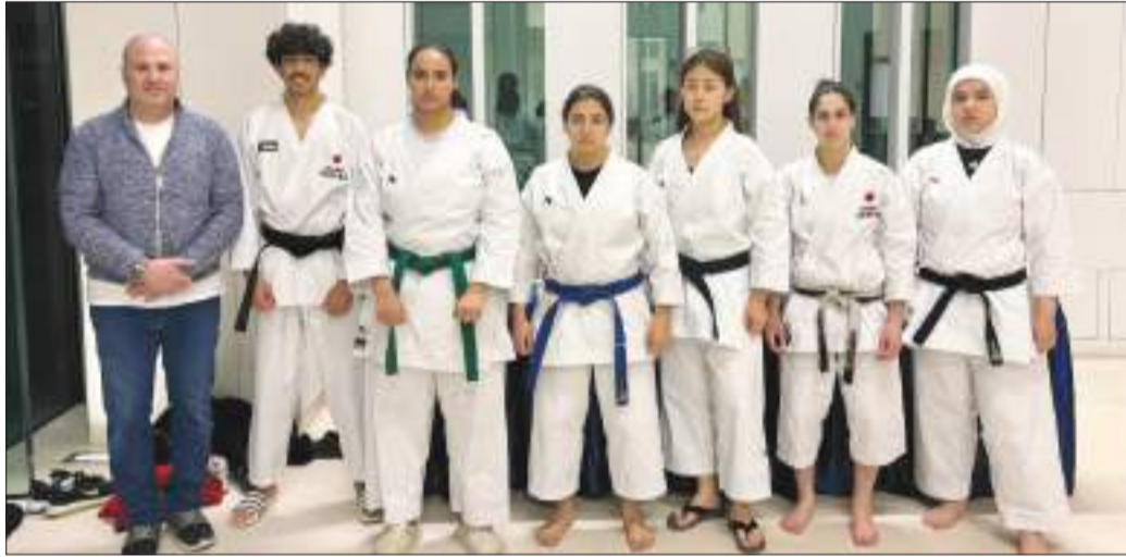
عدد من المشاركين في المسابقة

طرح مواضيع مختلفة باللغة اليابانية، والتي تعكس دور مركز خدمة المجتمع والتعليم المستمر بجامعة الكويت في دعم الطلبة في تعزيز مفهوم تبادل الثقافات لتعكس مدى أهمية تعليم اللغة اليابانية.