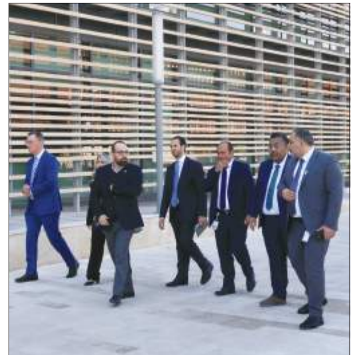
جانب من جولة الوفد في الكلية

كما تخلت الزيارة جولة تفقدية في مختبر أكاديمية سيسكو ومختبر سيمنز في كلية الهندسة والبتترول، وانتهت الجولة في مبنى الإدارة بجامعة الكويت.