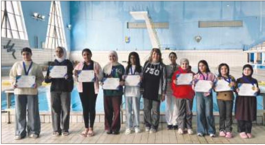
المشاركات في الدورة