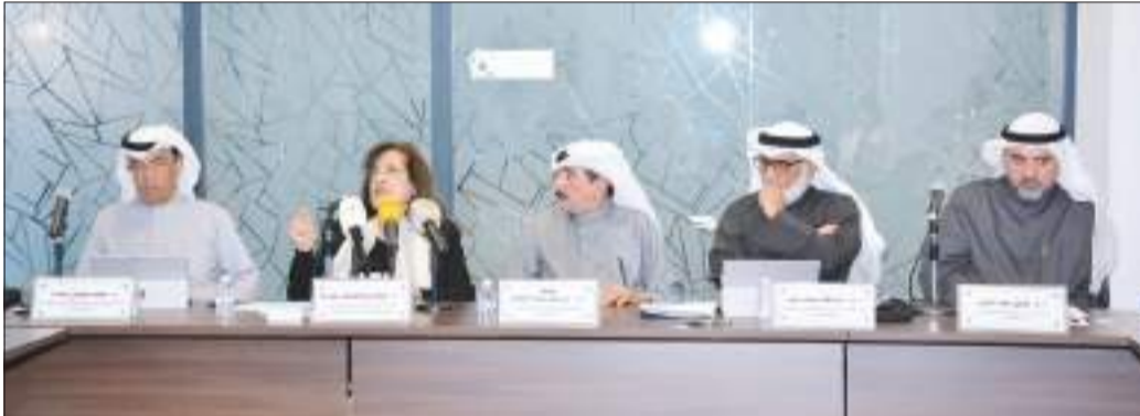
نخبة من الأساتذة المشاركين في الملتقى