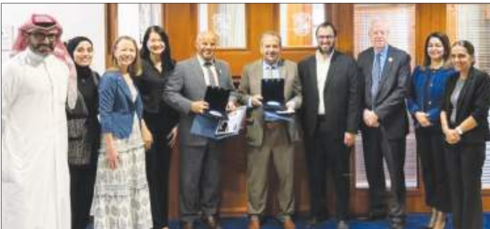
أسرة كلية طب الأسنان أثناء استقبالها الوفد الزائر

التعليم والتدريب المعتمدة بمركز العلوم الطبية وتحديداً كليتي الطب وطب الأسنان، وسبل وطرق تعزيز التعاون المشترك بين جامعتي الكويت وهيوستن لتطوير الكوادر الطبية.