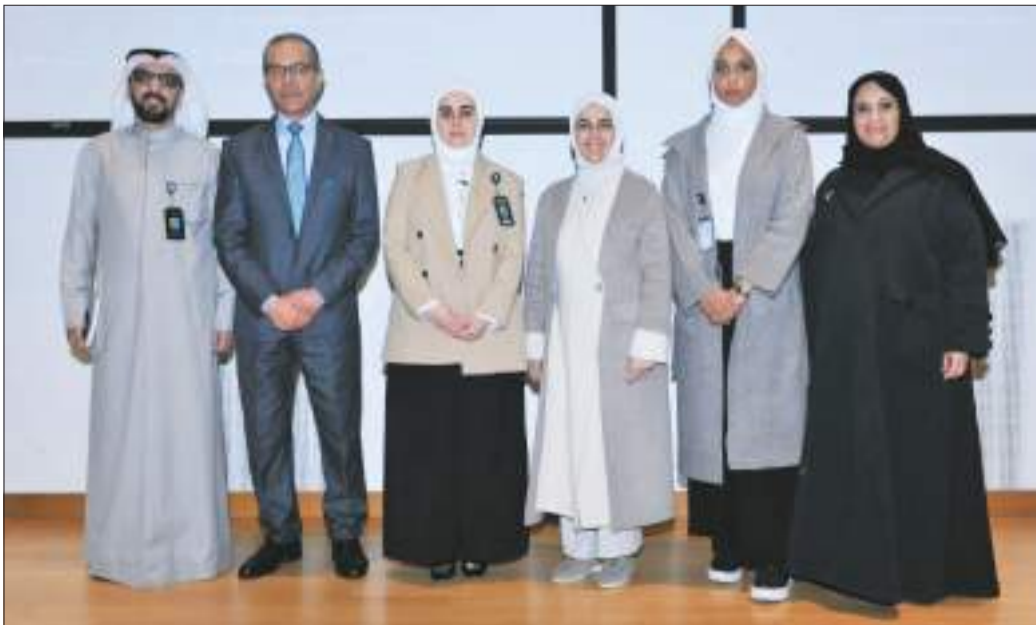
لقطة جماعية للمشاركين في الورشة

المتكررة، مضافة بأن النظام مزود بواجهة سهلة الاستخدام، مما يسهل على المستخدمين الوصول إلى خدمات الدعم وتقديم الطلبات بسرعة ويسر. واختتمت حديثها بأن النظام يعزز من تجربة المستخدم ويقلل من الاعتماد على فرق الدعم الفني للتعامل مع الاستفسارات والمشاكل البسيطة، حيث يساهم في رفع الكفاءة العامة لإدارة الخدمات التقنية في الجامعة. هذا وتخلل الورشة مجموعة من الأسئلة والاستفسارات.