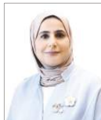
أ.د. نورية الكندري

وسيتم تسليط الضوء على كيفية مساهمة الأبحاث العلمية عالية الجودة في رفع تصنيف الجامعات والمؤسسات الأكاديمية عالمياً، مما