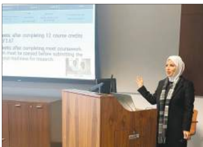
جانب من المحاضرة

الفصل الدراسي الثاني، وتقديم الخطة الدراسية المقترحة بناءً على المسار الذي تم اختياره من قبل الطالب، وفيما يخص مسار المشروع يجب على الطالب اجتياز الاختبار الشامل في نهاية الفصل الدراسي الثاني وقبل اجتيازه عدد 18 وحدة دراسية وقبل تسجيل مقرر المشروع، كما أن الاختبار يركز على عدد من المواضيع التي تحددها اللجنة، مؤكدة على أن الرسوب في الاختبار الشامل تجب إعادته في الفصل الدراسي التالي كما يمكن التحويل لمسار الأطروحة وفق لوائح كلية