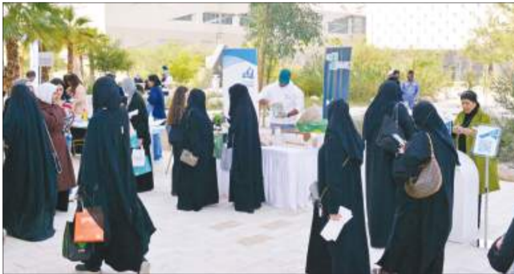
...وجانب آخر من المعرض

البلهان: المعرض يسלט الضوء على أهمية رفع مستوى الوعي بالصحة العامة للفرد بجميع نواحيها