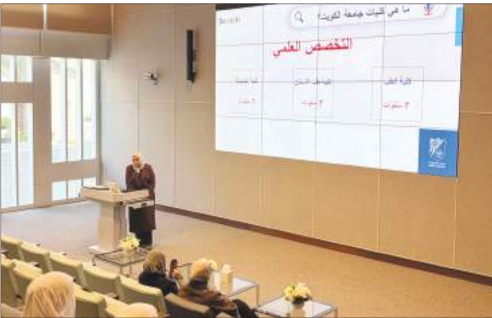
جانب من الجولات المجتمعية

المشاركة ضمن جهود المركز لتعزيز التواصل والوعي لطلبة وطالبات الثانوية المقبلين على المرحلة الجامعية