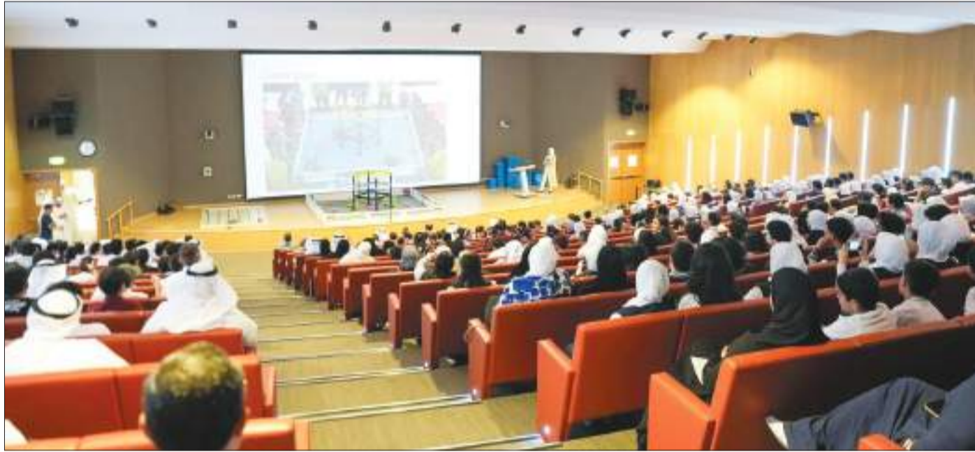
حضور بطولة الكويت الوطنية للروبوتات

شهد اللقاء تفاعلاً كبيراً من قبل الطلاب، حيث قدموا العديد من الأسئلة والاستفسارات حول آلية المسابقة وكيفية تحسين أدائهم، وقد تم تنظيم ورشة عمل عملية قصيرة لتعريف الطلاب بكيفية استخدام الطائرات بدون طيار وإتقان المهام المطلوبة.