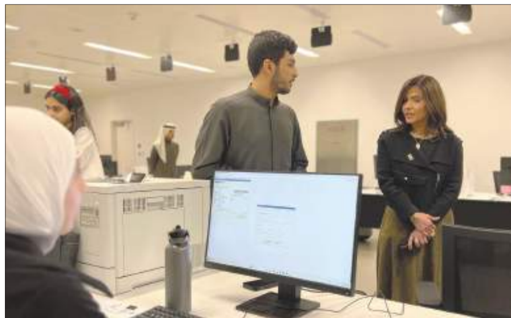
جانب آخر من جولة مديرة الجامعة

لهم فصلاً أكاديمياً جديداً مليئاً بالعطاء وتحقيق الطموحات والرقي والتميز.